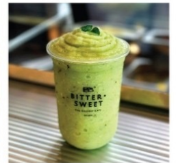
น้ำคั่วปั่น ใส่นม 60 บาท