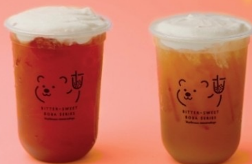
8-9 ใส่วิปมูส