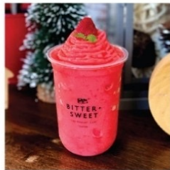
สตรอว์เบอร์รี่ปั่น ไม่ใส่นม 50 บาท ใส่นม 60 บาท