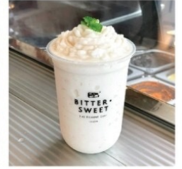
น้ำมะพร้าวปั่น 65 บาท