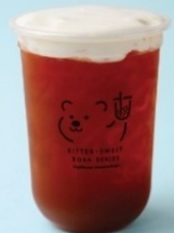
7. Assam Lemon Tea