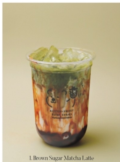
1. Brown Sugar Matcha Latte