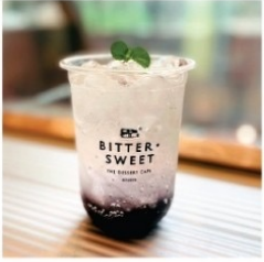
บลูเบอร์รี่โซดา 50 บาท