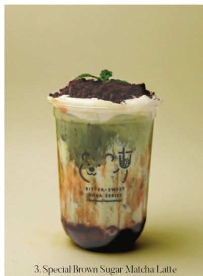
3. Special Brown Sugar Matcha Latte