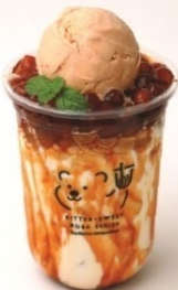
5. Brown Sugar Assam Black Tea Float