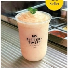
กระท้อนลอยแก้วปั่น 65 บาท