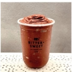
ช็อกโกบานาน่ามิลค์ 70 บาท