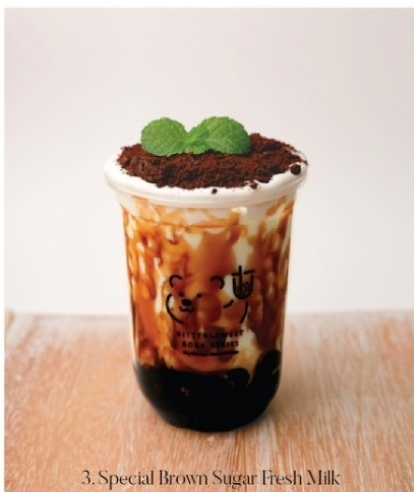
3. Special Brown Sugar Fresh Milk