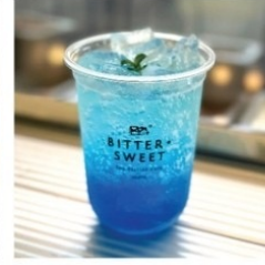
บลูโซดา 50 บาท