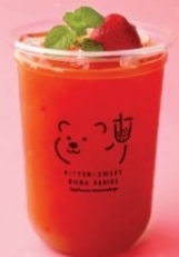
8. Assam Strawberry Tea