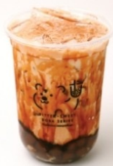
1. Assam Black Tea Latte