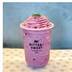
มิกซ์เบอร์รี่ปั่น ใส่นม 60 บาท