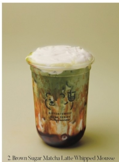
2. Brown Sugar Matcha Latte Whipped Mousse