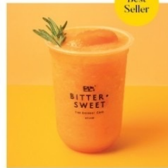
มะยงชิดปั่น 85 บาท