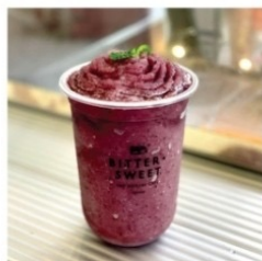
มิกซ์เบอร์รี่ปั่น ไม่ใส่นม 50 บาท