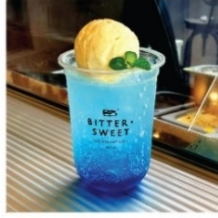
เกลาะเสม็ด 90 บาท