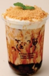
3. Special Assam Black Tea Latte