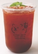
6. Assam Black Tea