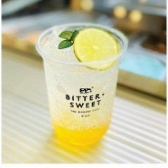
มะนาวโซดา น้ำผึ้งมะนาวโซดา 50 บาท/60 บาท