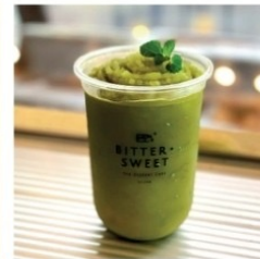
น้ำคั่วปั่น ไม่ใส่นม 50 บาท