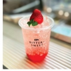
สตรอว์เบอร์รี่โซดา 50 บาท