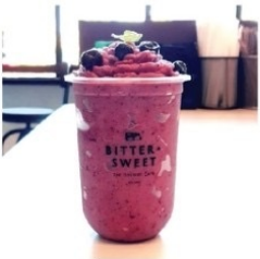
บลูเบอร์รี่ปั่น ไม่ใส่นม 50 บาท ใส่นม 60 บาท