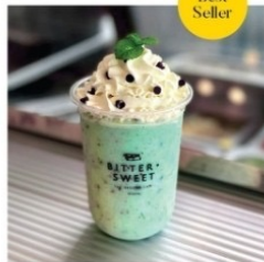
มินท์ช็อกชฟปั่น 110 บาท