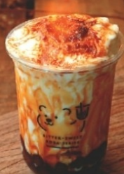
4. All-in Assam Black Tea