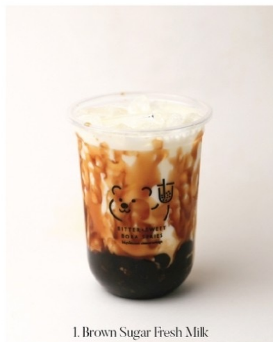
1. Brown Sugar Fresh Milk