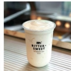
นมกล้วยปั่น 70 บาท