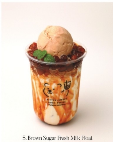
5. Brown Sugar Fresh Milk Float