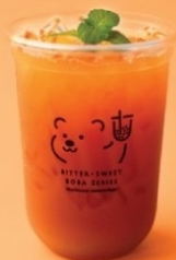
9. Assam Sunkist Orange Tea