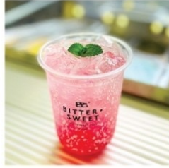
แดงโซดา 50 บาท