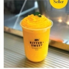
น้ำมะม่วงปั่น 65 บาท