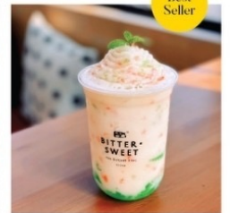
ยาคุลท์ ไซป์ปั่น 70 บาท