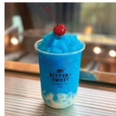
บลูโอเชียนโยเกิร์ต 70 บาท