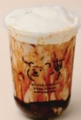
2. Assam Black Tea Latte Whipped Mousse