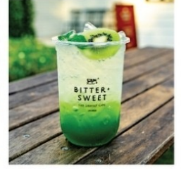
คีวีโซดา 50 บาท