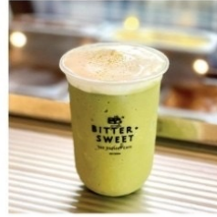
มัทกะลาเต้ปั่น 75 บาท